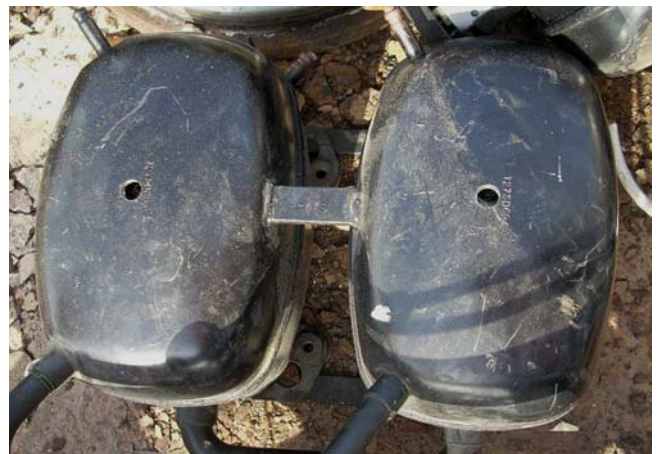
Angebohrte Kältekompressoren können nach dem «grünen» Kontrollverfahren exportiert werden.