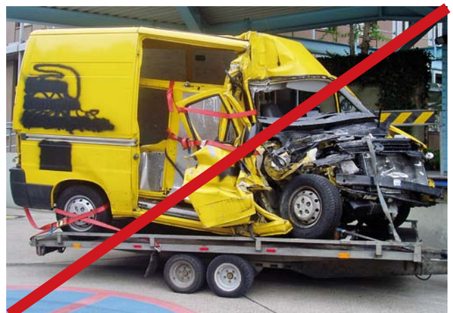
Stark deformiertes Fahrzeug