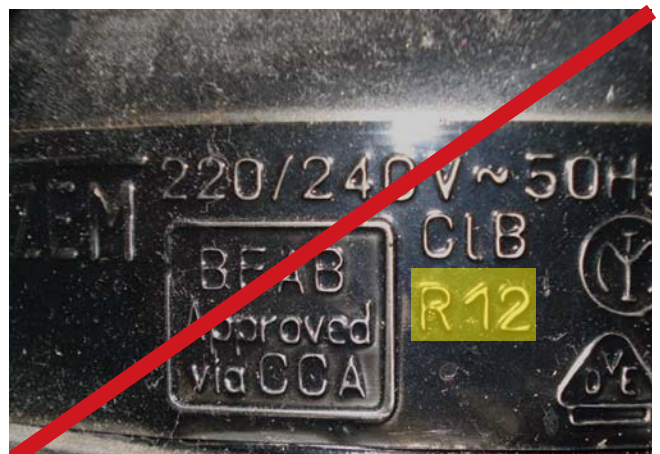
Kältekompressor mit verbotenem Kältemittel R12