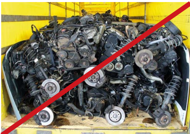
Fahrzeugsatzteile, die Öl verlieren