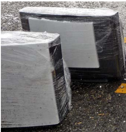
Mit Karton oder Styropor vor Beschädigung geschützte Bildschirme

*Hierzu gehört insbesondere auch die Ausfuhr mehrerer defekter Geräte mit dem Ziel, ein einziges funktionsfähiges Gerät herzustellen.