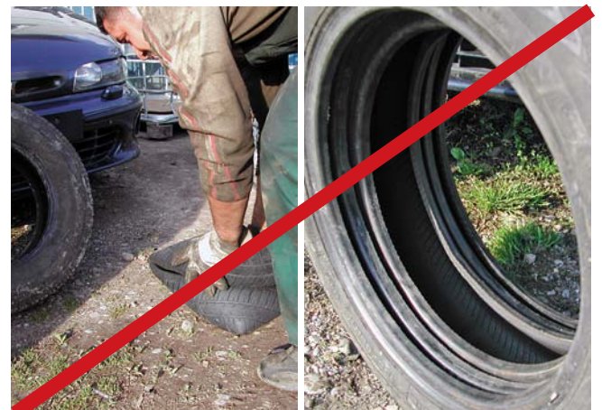
Duplieren und Triplieren von Reifen

Hinweis: Die Ausfuhr von duplierten und triplierten Reifen ohne Bewilligung ist nur dann zulässig, wenn der Reifenhändler durch seine Teilnahme am Kontrollsystem des Reifen-Verbandes der Schweiz (RVS) sicherstellt, dass ausschliesslich gebrauchsfähige Reifen mit einer Profiltiefe von mindestens 1,6 mm ausgeführt werden. Weitere Informationen finden sich unter www.swisspneu.ch .