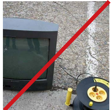
Gerät lässt sich nicht einschalten