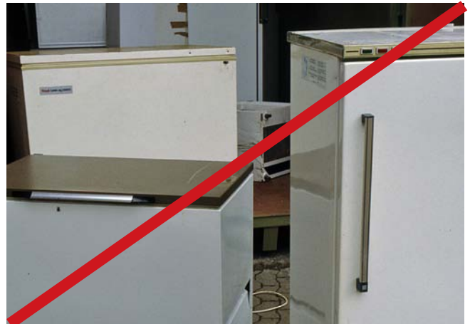
Ältere Kühlgeräte mit ozonschichtabbauenden Stoffen