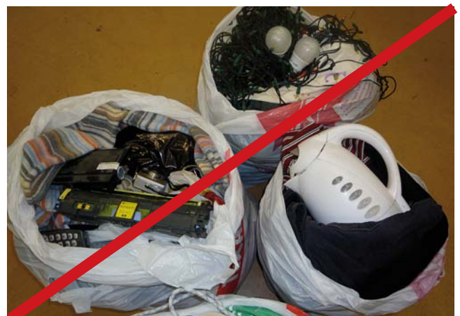
Unkontrollierte Textilien aus Sammelcontainern