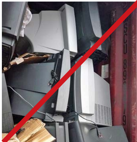
Unzureichende Verpackung von Bildschirmen