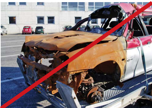
Fahrzeug mit ausgebranntem Motorraum

Um zu beurteilen, ob ein Unfallfahrzeug eine geringe Deformation aufweist, kann das «Schema zur Beurteilung von Unfallfahrzeugen» als Entscheidungshilfe herangezogen werden.