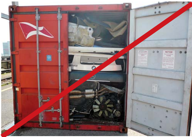
Fahrzeugsatzteile ohne Packliste