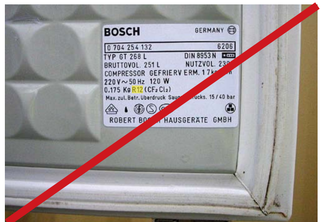
Kühlschrank mit verbotenen Kältemittel R12